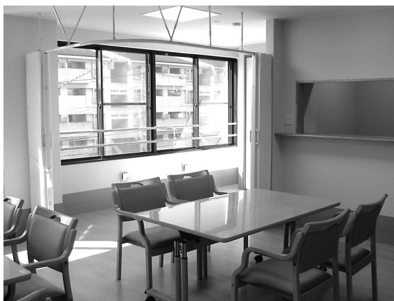
日当たりのいい居室