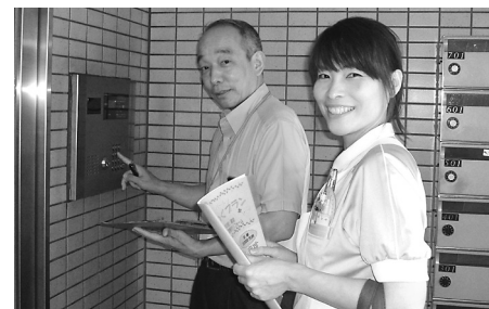
組合員さん宅を訪問

「なないろの家」は、宿泊室やお風呂、トイレ、リビングなど美装もほぼ終わり、工事完了も間もなくです。これから備品が入り、11月の開設に向けてどんどん準備を進めていきます。新しいバスタオルやタオルなど、もしお家に使わないものがございましたら、ご協力お願いいたします。(本部 ☎6322-5290) 職員14名、組合員8名の計22名の参加で、第4回となる統一行動を行いました。淡路診療所に集合し、そこから10班に分かれて地域の組合員さん宅を訪問しました。淡路診療所や皮膚科歯科診療所も近いことから「前に増資したよ」「知ってるよ」という声も多い半面、転居されていることがわかった方も多くありました。